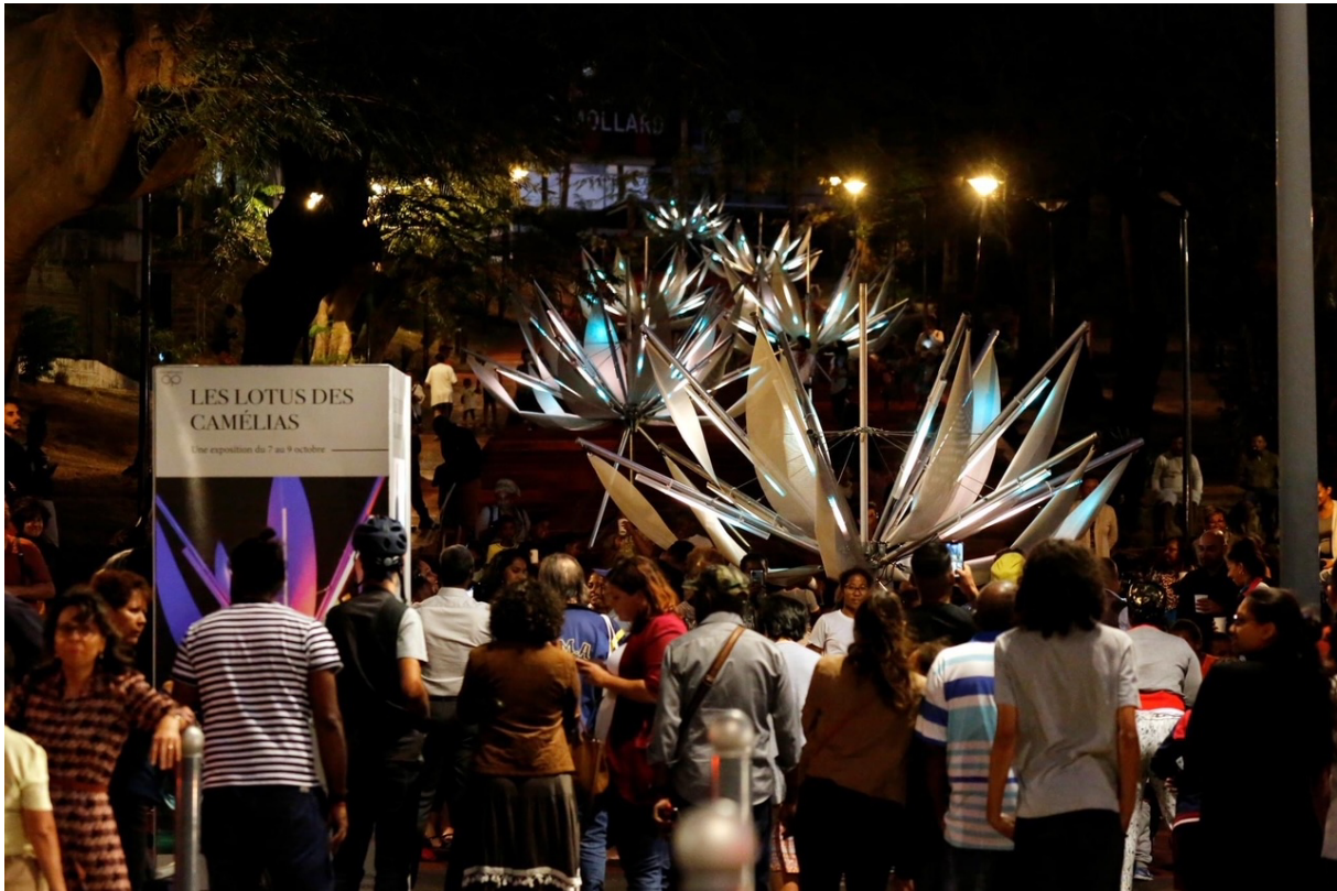
Art Digital - Les Lotus dans le village des Camélias – Octobre 2022