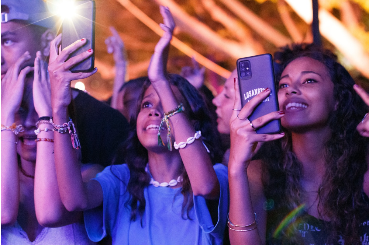
Electropicales Barachois Octobre 2022

70 artistes accueillis dont 50 % sont des locaux, 110 emplois (accueil, technique, production, administration, bar, billetterie...), 82 bénévoles (accueil, médiation, ...)